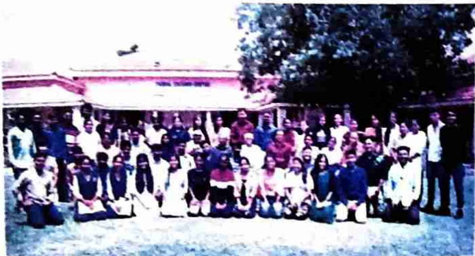
TATA STEEL FOUNDATION MRA- Initiatives of Change, Jamshedpur Effective Living and Leadership Program for the youth of NSS Students of Kolhan University 28 th June to 30 th June 2022